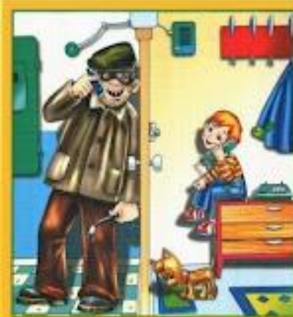
Не разговаривай и не открывай дверь незнакомым людям