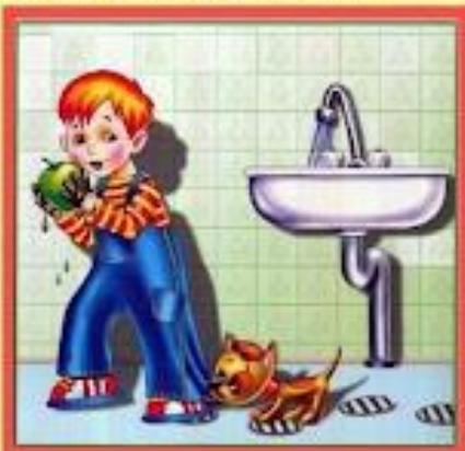
Мойте руки перед едой