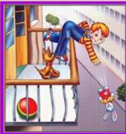
Не играй на балконе, упадешь